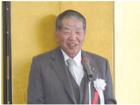
寺田会頭のあいさつ

去る一月九日(木)午前十時半より経済会館大ホールに於いて、大和高田商工会議所・(一社)大和高田経済倶楽部・葛城経営者クラブの経済三団体共催による恒例の「新春年賀会」を開催しました。